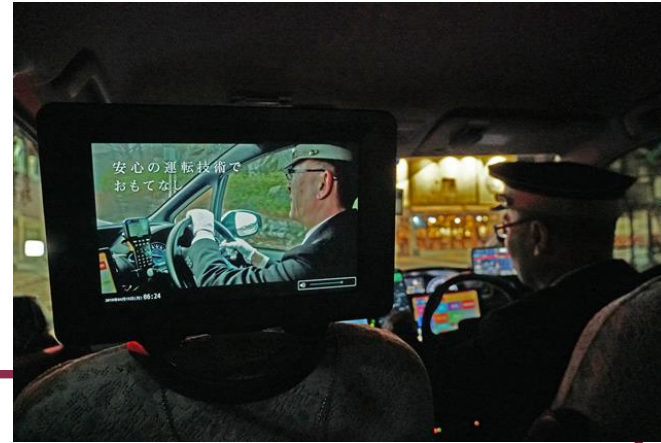
デジタルサイネージ見本

当商品はMKトラベルが販売いたしますので、MKグループの各広報媒体で宣伝を行います。